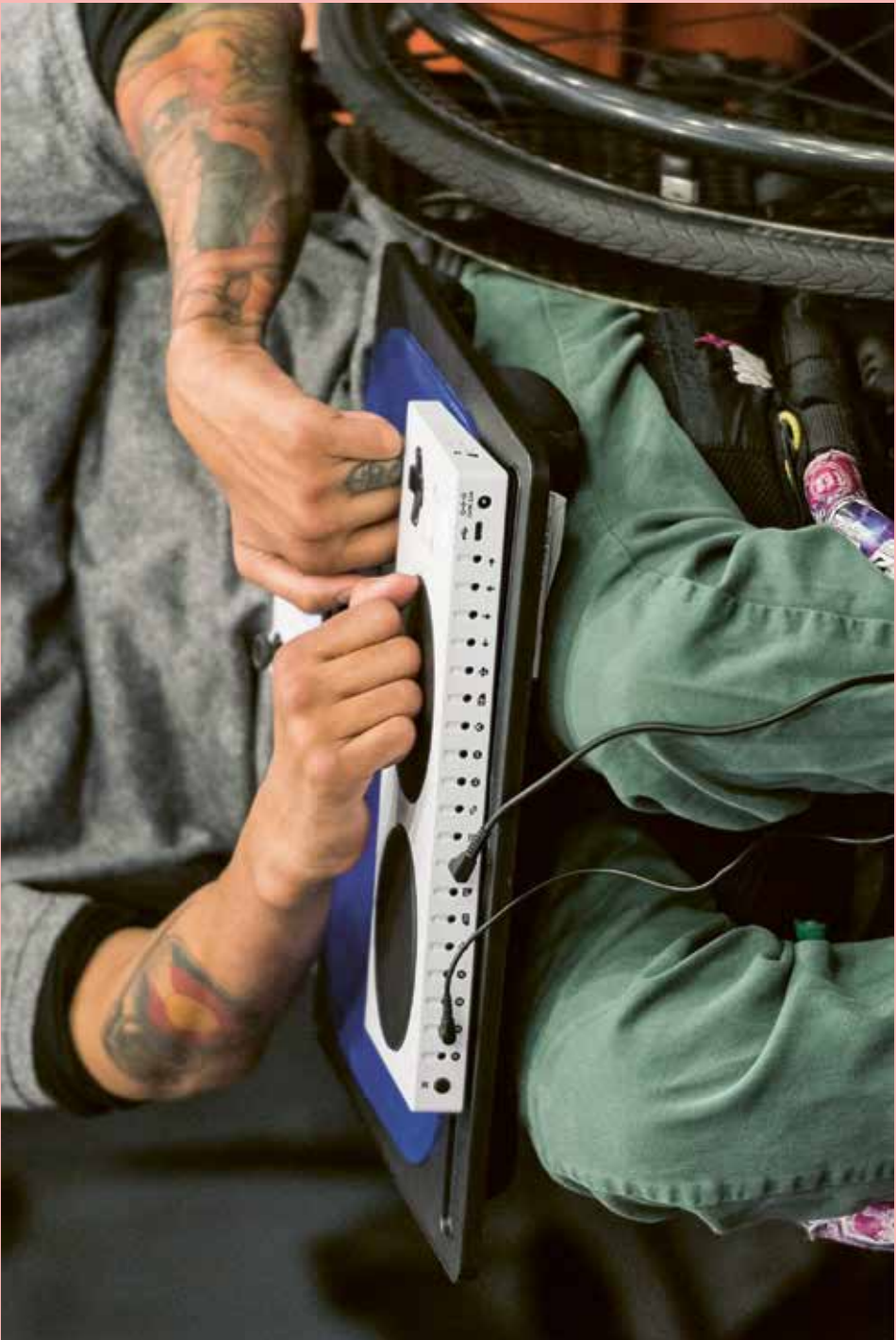
Der Xbox Adaptive Controller von Microsoft