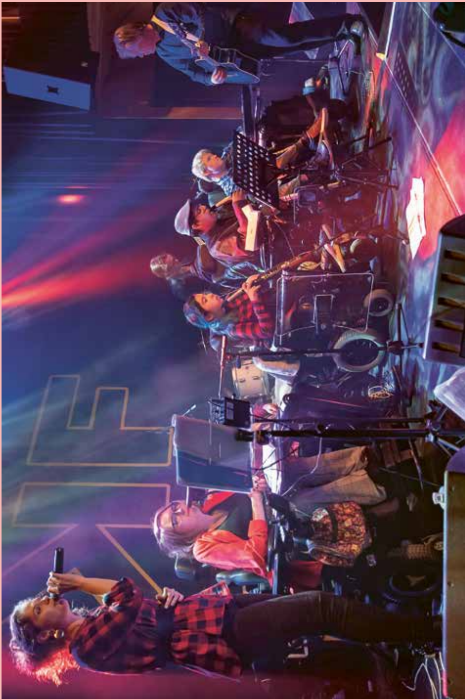
Die My Breath My Music-Band De Bridge