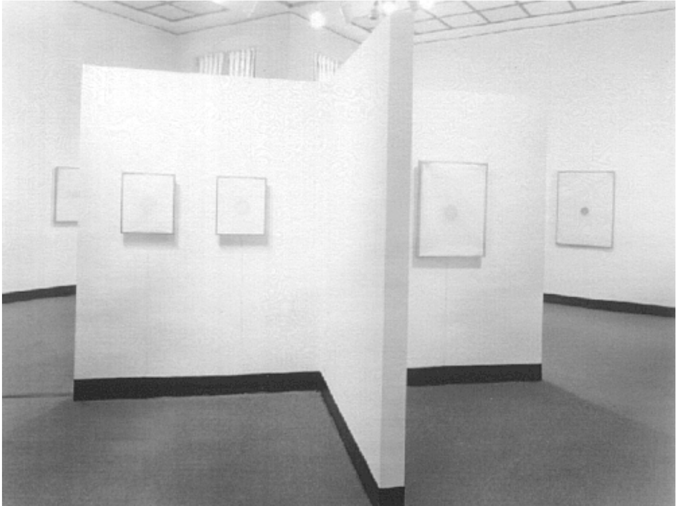
Ezra and Cecile Zilkha Gallery, Wesleyan University 1988

»Lucier eröffnet den Blick auf bislang nicht Gehörtes, das gleichwohl schon immer in den Dingen vorhanden war. Es scheint, als wolle er mit den Mitteln des wissenschaftlichen Experiments – und allein die ästhetische Unbestimmtheit dieser Mittel ermöglicht dieses Vorgehen – die klingende ›Natur‹ der Dinge hörbar machen. Damit vielleicht nähert er uns wieder jener Faszination, die das antike und das frühmittelalterliche Denken der Musik gegenüber empfand: Doch ist es nicht mehr die Welt als Struktur einfacher Zahlen, deren Bild wir in solcher Musik widergespiegelt sehen. Im Gegenteil: Die nicht-menschliche Komplexität, die das Einfachste in sich birgt, bewegt den Hörer.«