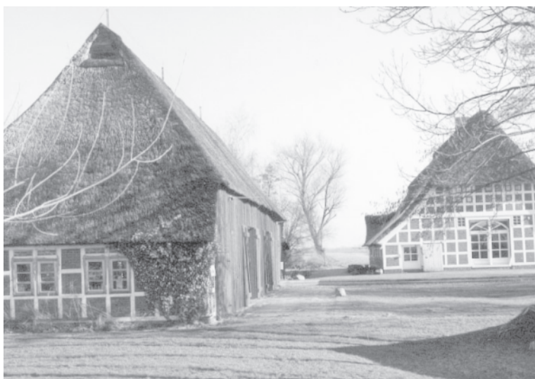
KunstRaums Drochtersen-Hüll mit der Scheune (links).

linie schließlich ist Im Porträt , in der wir eine lebende Komponistin oder einen lebenden Komponisten musikalisch und persönlich vorstellen und das Publikum zu Gesprächen mit der Komponistin/dem Komponisten einladen. Geht es bei Passagen um eine innermusikalische Fragestellung, zielt Between Categories auf den Dialog zwischen den verschiedenen Künsten, Im Porträt versucht, die vielfältigen Positionen neuer Musik ausführlich vorzustellen. Was hier so streng geteilt aufgelistet ist, vermischt sich allerdings in den Programmen.