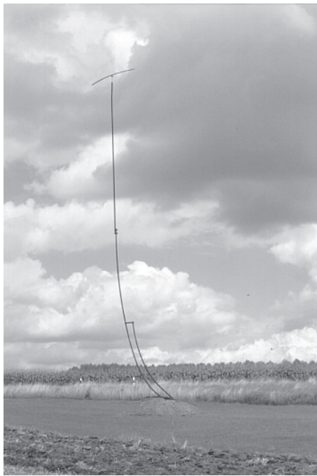
Klang- und Windzeichen von Grimma bis Kaditzsch (April 2001 bis April 2002) von Paul Fuchs, Foto: G. Nauck.

Ein interessanter Aspekt ergibt sich dabei daraus, daß in der großformatigen Landschaft auch Prozeßhaftes enthalten ist, sich hier ebenso Ordnungsstrukturen wie Formauflösungen und Transformationsprozesse wahrnehmen lassen. Die Interaktion von akustisch und visuell wahrnehmbaren Phänomenen und der integrative Ansatz bei der Aufführungspraxis der Konzerte, Performances und Installationen beinhalten ein duales Prinzip wechselseitiger Einflußnahme. Das Oszillieren von Wahrnehmung zwischen diesen verschiedenen Phänomenen bringt auch die zeitliche Dimension ins Spiel, denn die entstehenden, nur partiell faßbaren Zwischenwelten stimulieren komplexe Wahrnehmungsprozesse.